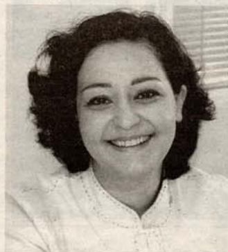
La delegada de Obras Públicas. E.A.