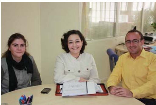
Reunión con la delega de Obras Públicas

Alpedal Almería presenta a la delegada de Obras Públicas un proyecto para la promoción de la bicicleta en los centros de trabajo de la Junta